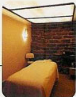
上:マッサージ室。指圧は30分130ドル。ほかにホットストーンマッサージ、アロマセラピーなども楽しめる。右:石でできたサウナ室。