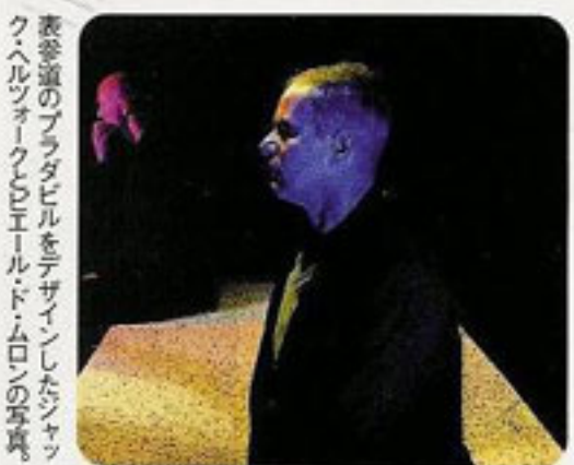
表巻道のプラダビルをデザインしたシャック・ヘルツォークとビル・ド・ロンンの写真。