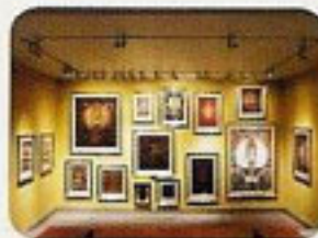
右:ヴァジャラバコと呼ばれるチベットの仏像画。上:3階の壁いっぱいに絵画が展示される。