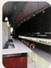
左:これが噂の混浴ジャクジー。プールと同じ感覚なので、水着は着用のこと。上:化粧品売り場の横にある、自然食のカウンター式カフェ。