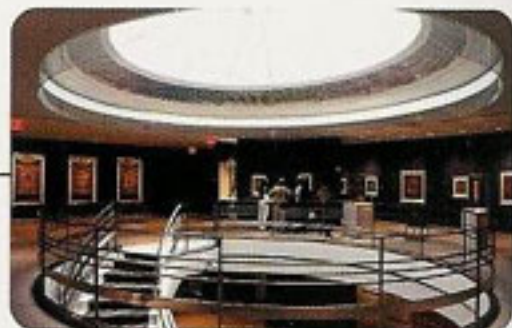
天窗からの光も優雅な、6階の展示場。もともとは、バーニーズNYのシャネルなどの高級品売り場だった。